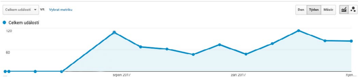
Graf zobrazující počet zobrazení vysouvacích panelů.

Ruku v ruce s tímto úspěchem tým Collabimu začal plánovat i další kroky, jak Beyond využít. Chce dál rozšiřovat a propojovat obsah, který na svém webu má. Přidávat více odkazů do aplikace a získávat výsledky z nově nasazených Beyond odkazů i z hlavní prodejní webové stránky.